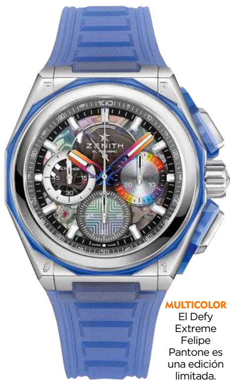
MULTICOLOR El Defy Extreme Felipe Pantone es una edición limitada.

La manufactura suiza no para. A la serie de novedades y reediciones que ha sacado este año ahora se suma una nueva colaboración con Felipe Pantone. Zenith y el artista argentino afincado en Valencia ya trabajaron juntos el año pasado en varias piezas, una de las cuales fue el reloj donado a la subasta benéfica Only Watch. La nueva colaboración vuelve a tener el color como protagonista, esta vez aplicado al modelo más radical y tecnológico de Zenith. El Defy Extreme Felipe Pantone entusiasmará a los amantes del color. La caja de acero de 45 mm viene acompañada de un bisel y protectores de los pulsadores de aluminosilicato de itrio, una variante sintética del